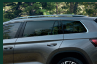
SunSet tylne szyby boczne i szyba pokrywy bagażnika o wyższym stopniu przyciemnienia