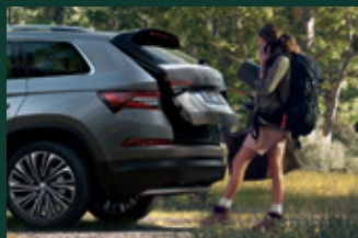
Elektrycznie sterowana pokrywa bagażnika z bezdotykową obsługą